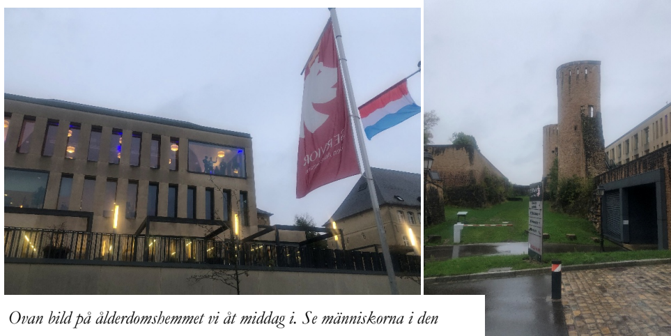
Ovan bild på ålderdomshemmet vi åt middag i. Se människorna i den stora glasrutan! Till höger, bild på det gamla fortet det låg insprängt i.

Middagen dag två hölls i ett ålderdomshem! Det ligger insprängt i en del av världsarvet som varit ett fort och har fin utsikt. Maten lagades av hemmets restaurang och var mycket bra.