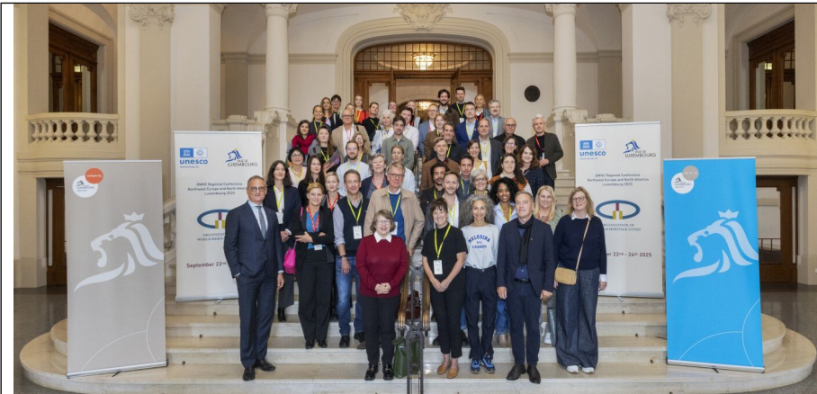
Gruppbild från konferensen.