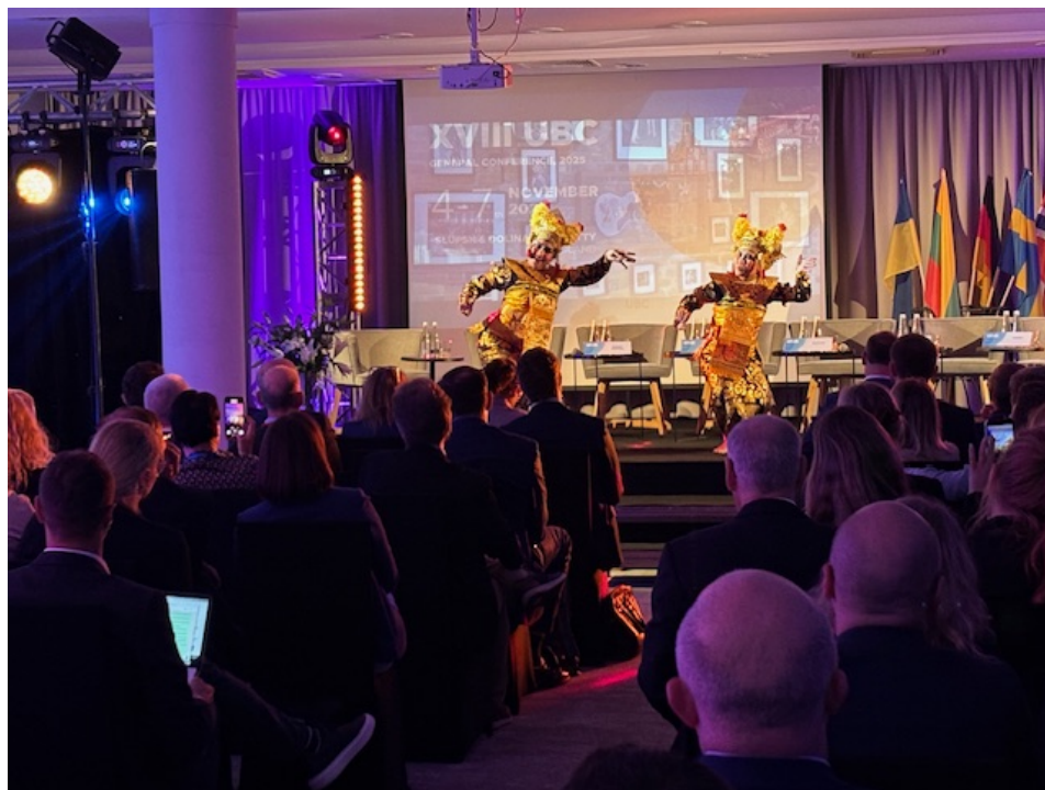
Bild. Traditionsenligt bjöds det på underhållning som inledning, indonesisk dans.