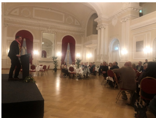
Välkomstmiddag i rådhusets stora sal med tal av lokala politiker.