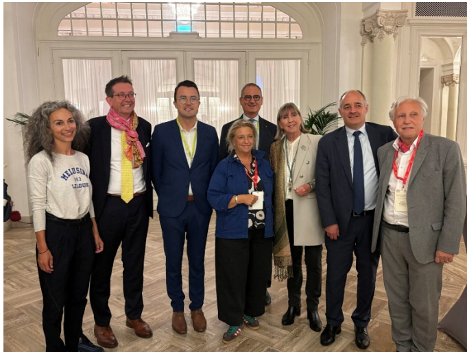
Gruppbild från konferensen med representanter från arrangören staden Luxemburg bl.a. borgmästare Lydie Polfer i mitten med Meit Fohlin.